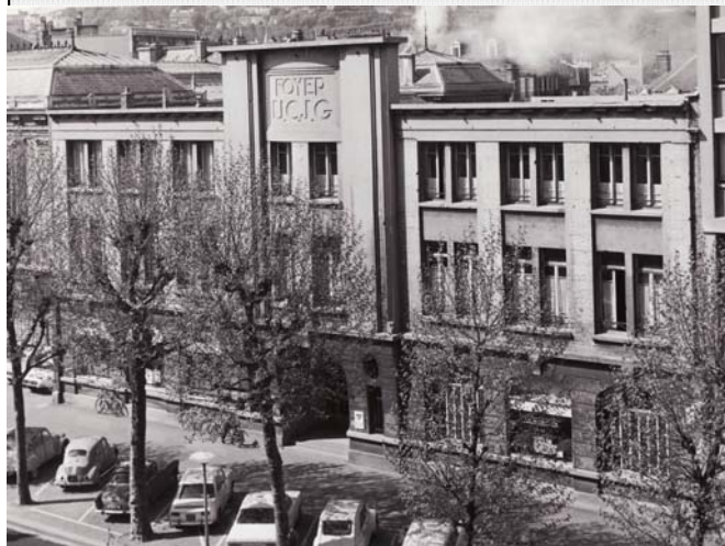
UCJG Schweitzer au Havre en 1970 et en 2009 ...